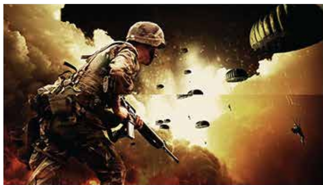
VRR非対応 ティアリング発生

ゲーム内処理速度の変動時に発生する「ティアリング (画面のズレ)」、「スタッタリング (カクつき)」を無くし、快適なゲームプレイを体感いただけます!