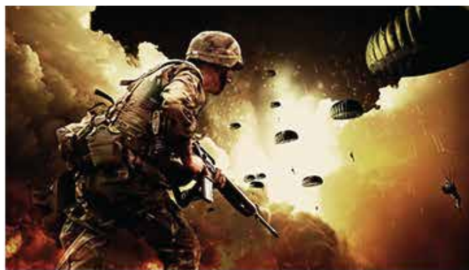
VRR対応 ティアリング未発生