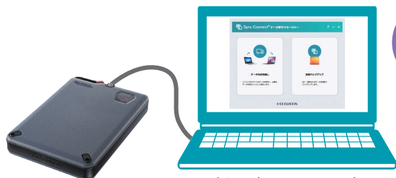
新PC (Windows 11)

完了したら、SSDを旧PCから外し、新PCに接続します。パスワードロック解除後、 「Sync Connect+ データ移行マネージャー」が自動で起動 します。