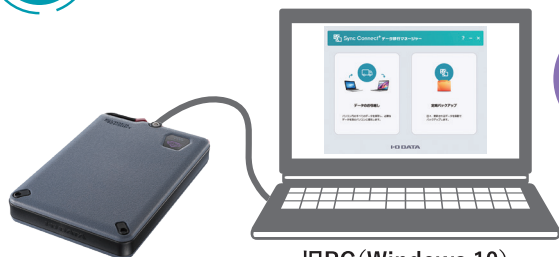
旧PC (Windows 10)

旧PCにSSDを接続し、パスワードロックを解除すると、 「Sync Connect+ データ移行マネージャー」が自動で起動 します。