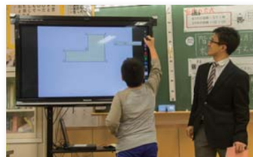
タッチペンの様々な機能を使って