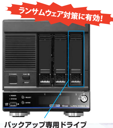
バックアップ専用ドライブ