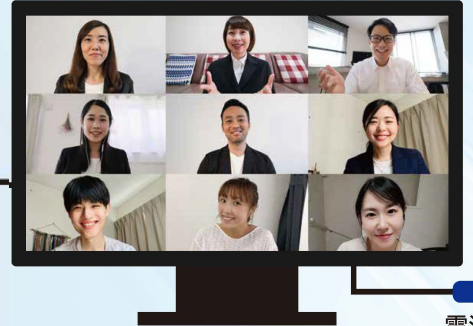
USB Type-C®搭載 液晶ディスプレイ