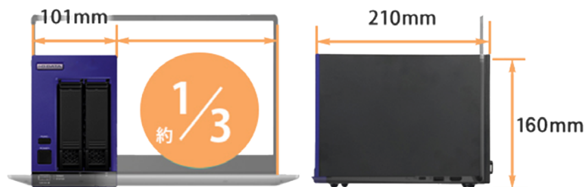
A4ノートPC約3分の1の設置面積

小規模オフィスやグループでの利用を想定したコンパクト設計。サーバーラームはもちろん、システム管理者のデスクサイド、キャビネットといったオフィス内に設置ができるためメンテナンスに便利です。