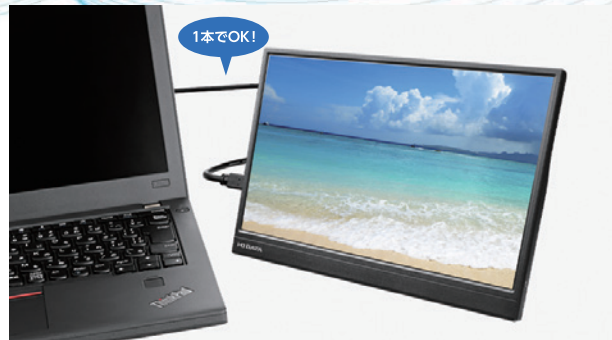
束ねて持ち運ぶのに便利な柔らかいケーブル

※パソコンに映像出力(DisplayPort Alt Mode)対応のUSB Type-C ポートが必要 です。 ※給電が足りない場合はDC5V/1.5A以上供給可能なUSBケーブルとUSB充電器 を別途ご用意ください。