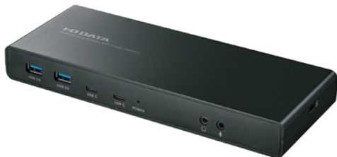
USB Power Delivery対応 ドッキングステーション